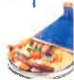
Entrée sandwiches compotes