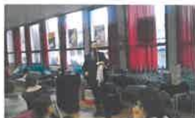
Le Vilain Petit Canard Mars 2015