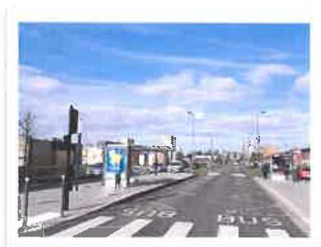
Avenue Henri Dunant