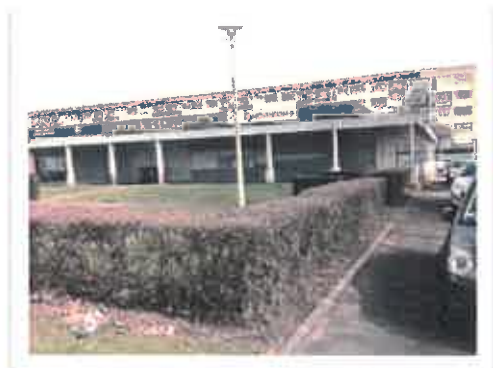
Local de la Mousserie 5 bd Léon Jouhaux

Sur la zone de l'Union qui concerne Wattrelos, Roubaix et Tourcoing, les acteurs sociaux des trois villes se mobilisent afin d'éviter un clivage entre les anciens et les nouveaux habitants avec l'Université Populaire et Citoyenne, le collectif de l'Union et d'autres partenaires. Au-delà des Villas, les habitants sont plutôt satisfaits de l'ambiance.