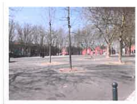
Place Carnot au quartier du Pile

Les quartiers Pile et Sainte Elisabeth : dans ces quartiers proches du centre-ville mais qui restent enclavés, les indicateurs socio-économiques sont aujourd'hui parmi les plus difficiles de la ville. Les habitants sont confrontés à des situations de précarité qui confinent à la pauvreté parfois même à la misère. La population est cependant très attachée à son quartier auquel elle s'identifie.