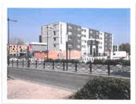
la Maison des services