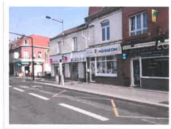
Local du Sartel

Le secteur du Sartel Laboureur est calme, animé par une rue commerciale centrale. Des brocantes, des lotos, des karaokés s'organisent avec l'appui d'HORIZON9 et d'habitants volontaires. Le quartier du Beck est constitué de tours dont deux abandonnées et murées. Les personnes ont été relogées et un questionnement sur le devenir de cet espace persiste.