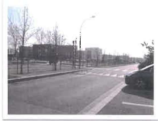
Place de Beaulieu : Les nouveaux aménagements

Le secteur de Beaulieu : depuis l'ouverture de la Maison des Associations, les jeunes sont plus visibles au niveau de l'Esplanade, dont les filles. La dynamique partenariale est présente. Les partenaires se mobilisent afin de développer le lien social entre les habitants notamment entre les différentes générations.