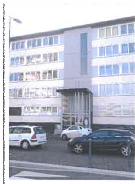
Local de Hem

Dans les quartiers Nord, l'ANRU 1 arrive à sa fin. L'aménagement des voiries, rue Schweitzer, s'est terminé après l'été. Le passage de la Liane (le service de transport public) s'est mis en place et circule sur ces nouveaux investissements. Le projet de l'ANRU 1 avait commencé en 2004. Il est certain que durant les différentes étapes de ces travaux, les habitants ont usé de patience et de tolérance jusqu'à ce que ce projet se finalise. Il est important maintenant de penser à la qualité de vie dans les quartiers, aux relations entre les habitants. Que faire maintenant dans un magnifique contexte environnemental à Hem ? Des conseils citoyens seront mis en place en 2015 afin que les habitants puissent continuer à s'exprimer et à agir en tant que citoyens acteurs dans leur ville, sur ce qu'ils souhaitent vivre à Hem et comment ils le souhaitent.